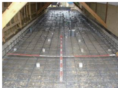
基礎を改修しながら、土間を防湿化