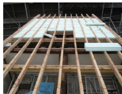
屋根に断熱材をいれている