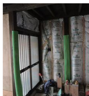
壁に断熱材を施工中