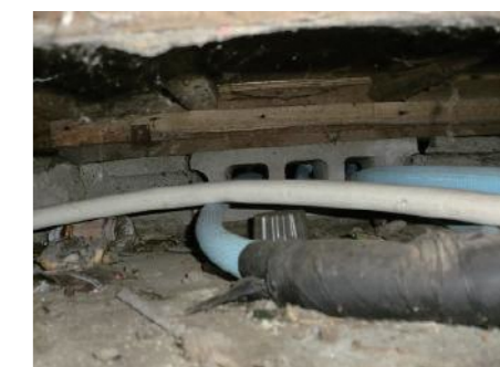
床下を通っている古い配管

町家は建物が細長いので、ガスや給排水の配管工事が長くなってしまいます。そのため、費用は多めにかかってしまいますが、古くなった管類は改修の際に更新しましょう。特に給水の鉄管は赤水のもとです。また大規模な改修であれば、水回りを楸の近くに配置すると配管の長さが短くなりコストダウンにつながります。