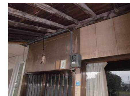
古い電気のメーター

また、配線の老朽化による漏電が原因の火災も発生します。老朽化や容量などを専門家に確認してもらいましょう。